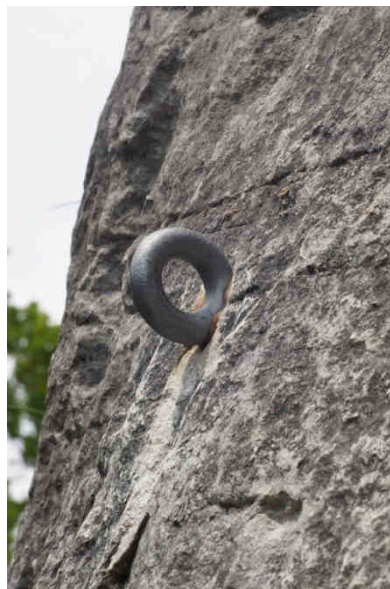
Amarrage de type « broche scellée »

Connecteur : mécanisme ouvrable qui permet de se relier directement ou indirectement à un amarrage (par exemple mousqueton, maillon rapide).